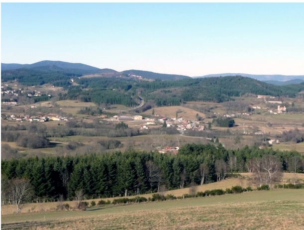
(vue de la Zone d'activité de l'Etang à Noirétable où est implanté le pôle bois)

Ce projet est réalisé sous la maîtrise d'ouvrage de la Communauté de Communes des