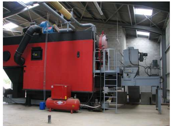
(Chaufferie bois Compte.R)

La société achètera le bois local et le transformera pour fournir aux utilisateurs : menuiseries industrielles, charpentiers, maisons ossatures bois, du bois aux normes européennes et aux conditions de transformations négociées.