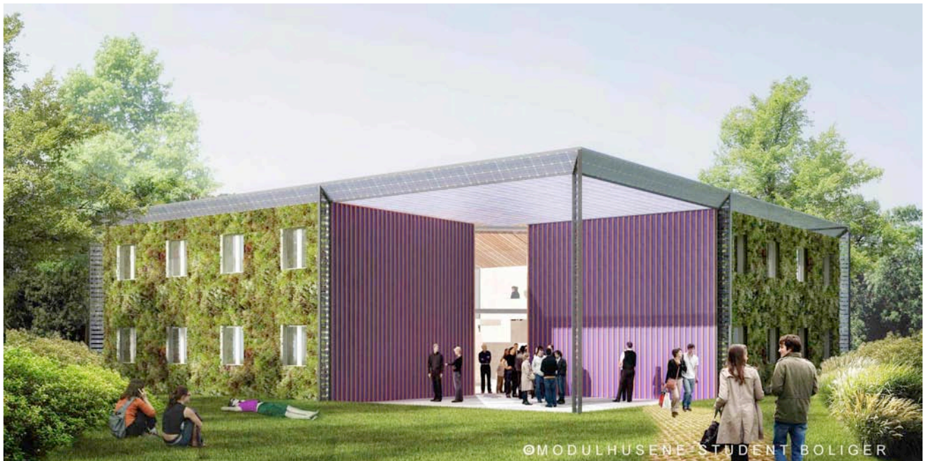
UN JARDIN VERTICAL EN FACADE PANNEAUX SOLAIRES SUR LE TOIT ET DANS LES CORNICHES