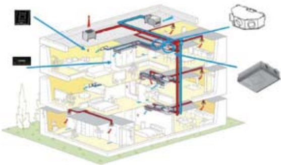
SCHÉMA DU RESEAU DE VENTILATION, PRÉSENTANT LES PRODUITS DU «TABLEAU DE BORD»