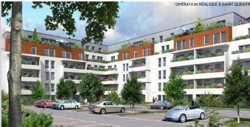
OPÉRATION RÉALISÉE À SAINT QUENTIN

Le logiciel « Projection », outil d'aide à la décision, génère un tableau de bord qui permet d'évaluer et simuler l'impact environnemental et le coût global (à 35 ans) du projet et des produits utilisés. A travers 120 questions, il prend en compte l'établissement du programme, l'intégration et la mixité, la proximité des infrastructures, la sécurité, la qualité de l'air, le confort sonore et le confort thermique, afin de choisir des systèmes économes en énergie et se soucier de la gestion des déchets.